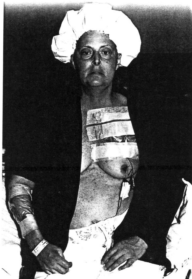
June 15, 1992 / January 30, 1992 / : #1 from intra-venus (15 de junio de 1992 / 30 de enero de 1992: núm. 1 de intra venus ), 1992-1993 dos paneles, impresión ultrabrillante / two panels, chromagenic supergloss prints 71.5 x 71.5"